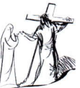
4 Station Jesus begegnet seiner Mutter