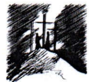
12 Station Jesus stirbt am Kreuz