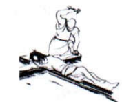
11 Station Jesus wird ans Kreuz genagelt