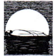
14 Station Der heilige Leichnam Jesu wird ins Grab gelegt